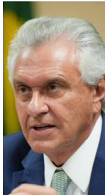
Ronaldo Caiado, governador de Goiás: medidas enérgicas contra Enel são exemplo para Lula e agentes do Governo Federal

A empresa já havia sido federalizada; o estado possuía 49% de suas ações. Com a venda, Goiás ficou com R$ 800 milhões líquidos. Em contrapartida teve que assumir dívidas que chegaram a R$ 7,5 bilhões.