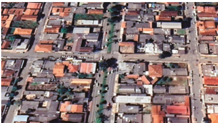
Uma das mudanças feitas pela CMTT foi na Rua Joaquim da Cunha, que faz cruzamento com a Avenida Presidente Kennedy, no bairro Maracanã

para verificar se a nova sinalização está sendo respeitada.