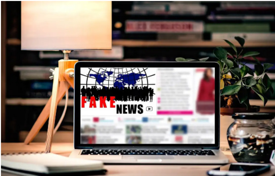
Na pesquisa, 62% afirmaram confiar na própria capacidade de diferenciar informações falsas e verdadeiras em um conteúdo

(24%) afirma já ter sido acusado de espalhar informações falsas por pessoas que têm uma visão de mundo diferente.