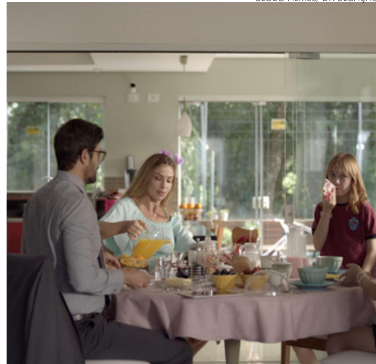
Grazi Massafera (ao centro) afirma que mulheres já se questionaram se estão enlouquecendo