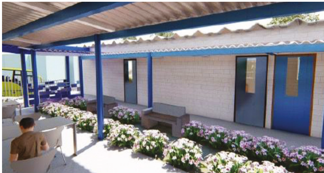
Clínica é construída em área de 2.485,75 m², com investimento total de R$ 1,803 mil do Anápolis Investe

"Garantir acesso à saúde e educação de qualidade é primordial e um direito fundamental para toda a população. Ao estabelecermos esse