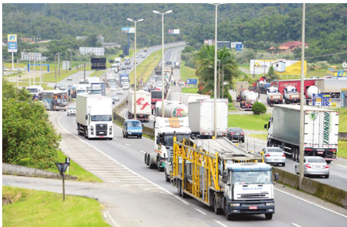
Segundo concessionária, rodovias 153, 414 e 080, no feriado da Páscoa, receberam mais de 209,9 mil veículos

O levantamento calcula desde a véspera do feriado, quinta-feira, 28, até o fim do Domingo de Páscoa, 31. Os números representam um aumento de 12% em relação aos demais dias da semana. Os dias com maiores movimentos foram justamente a quinta-feira, com 61.577 veículos, e o domingo, quando 63.017 percorreram o trecho na volta