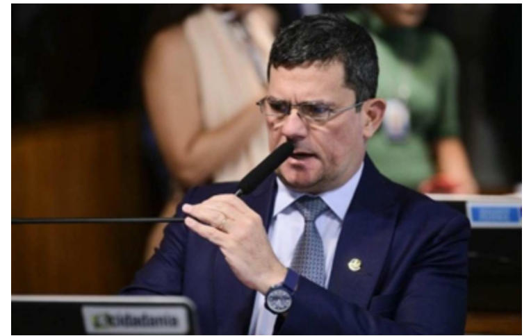
Sergio Moro: acusado de abuso do poder econômico