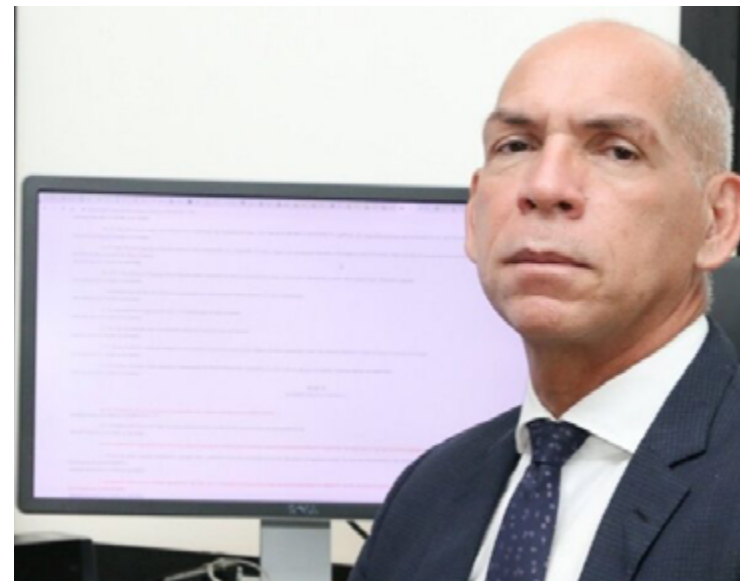
Sérvulo Nogueira: valorização da cidadania aos goianos