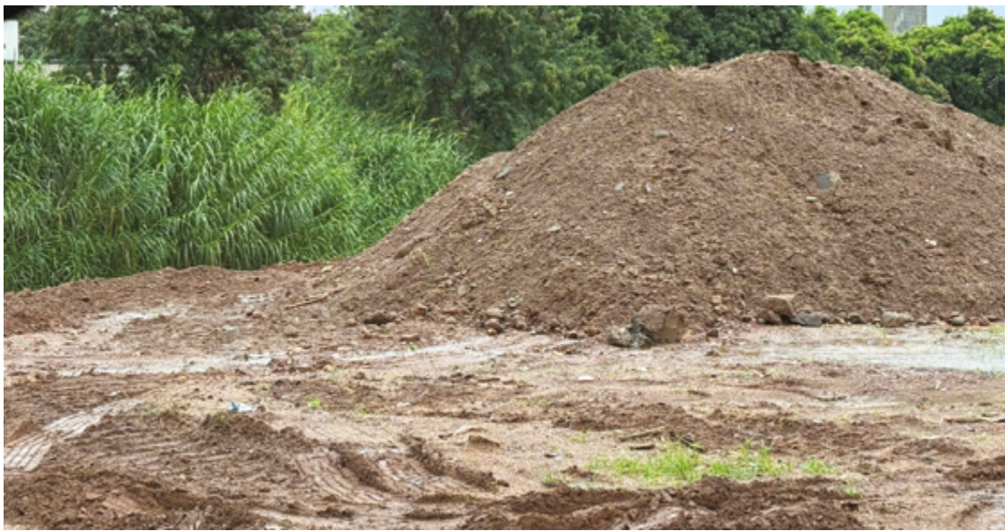
A cada chuva forte, máquinas retiram até 40 caminhões de terra e areia de córrego que passa pela Rua Amazílio Lino

em uma hora choveu 38 mm em Anápolis, de acordo com captação feita pela estação hidrológica Rio das Antas, do Centro Nacional de Monitoramento e Alertas de Desastres Naturais (Cemaden).