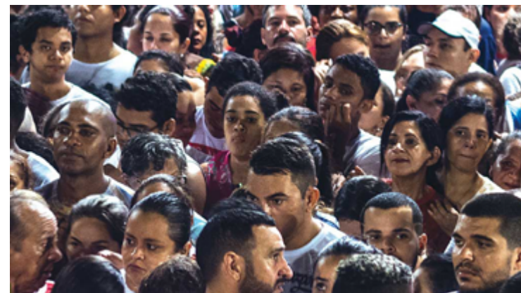
Brasileiro prefere ao modelo de democracia ao invés de regime ditatorial