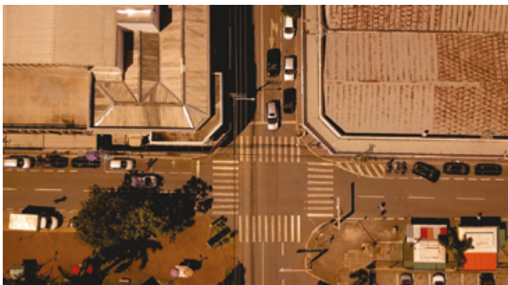
No fim de 2023 Anápolis já contava com uma frota de veículos nas ruas de 315.197 registrados; implicação dessa nova realidade exige mudanças

Segundo o diretor do órgão, há alguns pontos de menor aceitação dos moradores locais, como por exemplo a mudança na Rua Joaquim da Cunha, no bairro Maracanã. Nestes casos, a CMTT dá um prazo para adaptação e após o período a fiscalização passa a ser feita